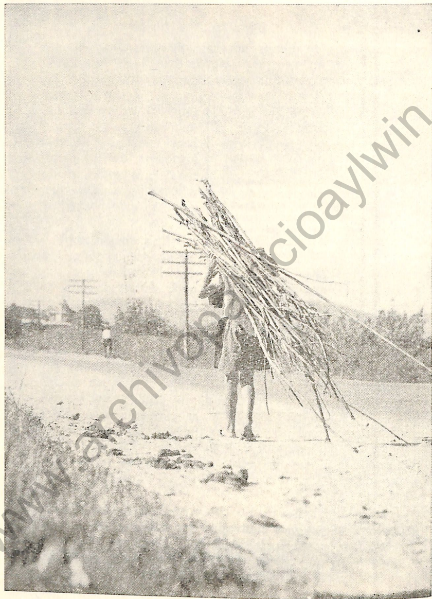
El niño campesino asistirá a la escuela y dejará estas penosas actividades