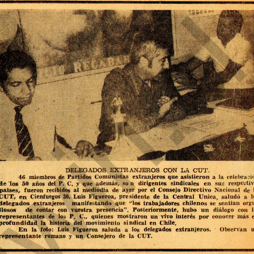
46 miembros de Partidos comunistas extranjeros que asistieron a la celebración...