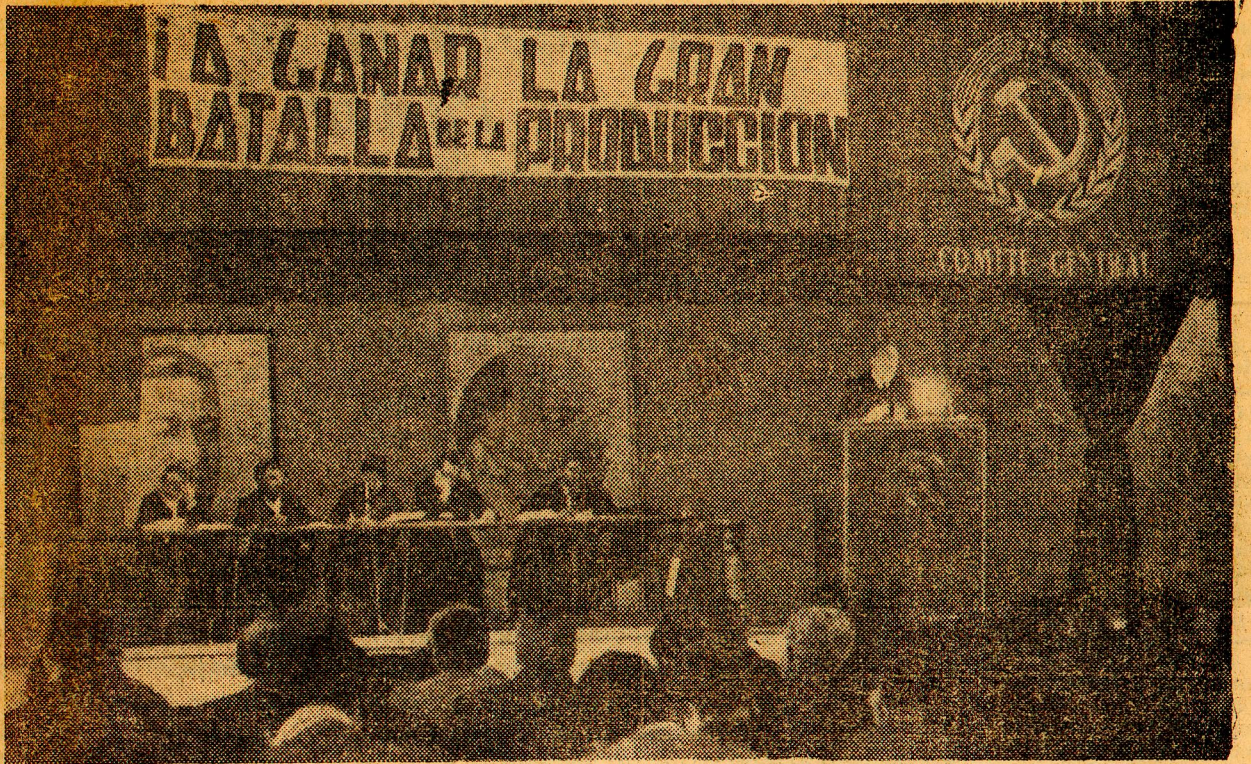
CONTINUA EL PLENO DEL PC Durante todo el día de ayer continuó el Pleno del Partido Comunista que se está realizando en esta capital. En el grabado, un aspecto de la sesión matinal, en los instantes en que el senador Volodia Teitelboim interviene, refiriéndose en algunos aspectos de su participación al discurso de Frei.