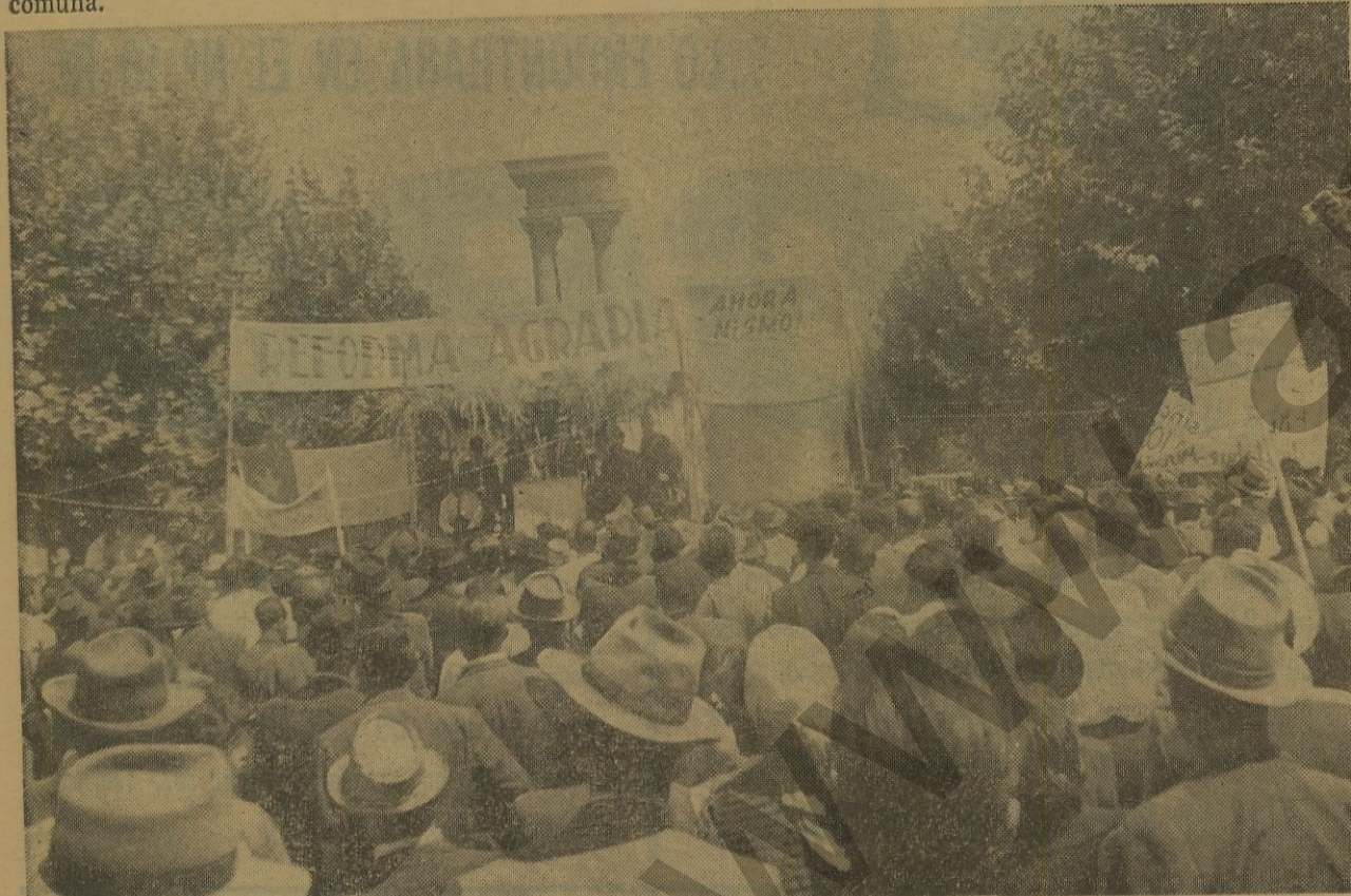
■ REFORMA AGRARIA: Buena imagen en el gran total...

Presentamos, entonces, la primera parte de la Encuesta Social, Económica y Política del Gran Santiago, entregándole las respuestas a las primeras 6 preguntas.