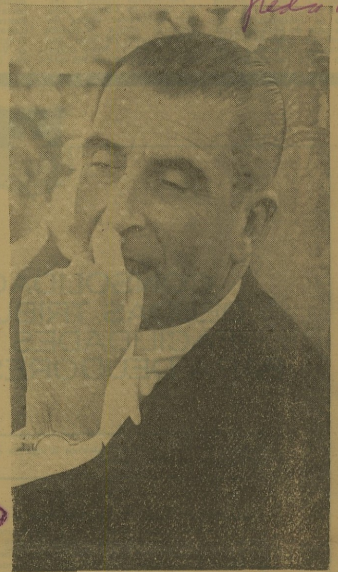
■ FREI: Visión santiaguina de su Gobierno...