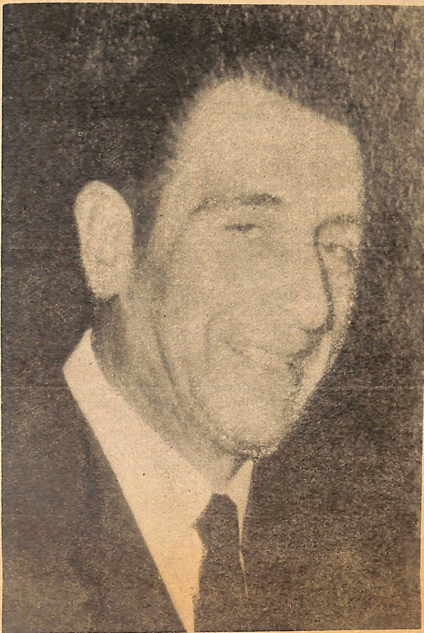
EDUARDO FREI: Ayer como Presidente de la República y hoy como ciudadano mira con profunda preocupación el futuro del país a manos del marxismo.

"Hemos aceptado el veredicto de las urnas y reconocemos y apoyamos en estos momentos a dos postulantes a Presidente de la República y que son los que obtuvieron las dos primeras mayorías relativas: el señor Allende y el señor Alessandri. Legalmente le corresponde al Congreso Nacional decidir cuál de los dos será el futuro Presidente de Chile, y a quien elijan ahí, sea quien sea, lo debemos apoyar y respaldar hasta las últimas consecuencias.