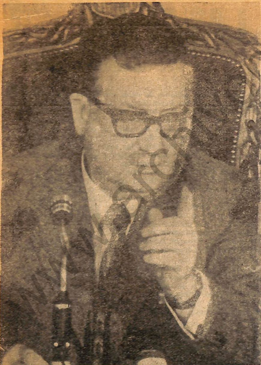
SALVADOR ALLENDE: Actual Presidente de la República, marxista-leninista declarado desde hace más de 40 años y quien ha hecho de la legalidad sobrepasada un trampolín para la implantación en Chile de la dictadura del proletariado, ley universal insalvable de toda revolución marxista-leninista.

Más adelante refiriéndose a los resultados electorales dice: