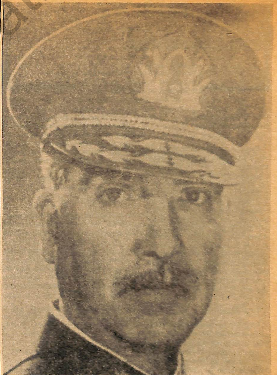
GENERAL RENE SCHNEIDER: Su pensamiento cobra actualidad en este instante de la Patria.

Esta crónica repone las cosas a su justa y precisa verdad. No podrá el marxismo gobernante seguir especulando con el pensamiento y el sacrificio del General Schneider. Aquí está su pensamiento —recogido en las actas del Consejo de Generales— sus inquietudes, sus temores y su posición. Es bueno que Chile conozca estas ideas que sin duda inspirarán mañana, como inspiran hoy, la acción de los institutos armados como suprema garantía de democracia.