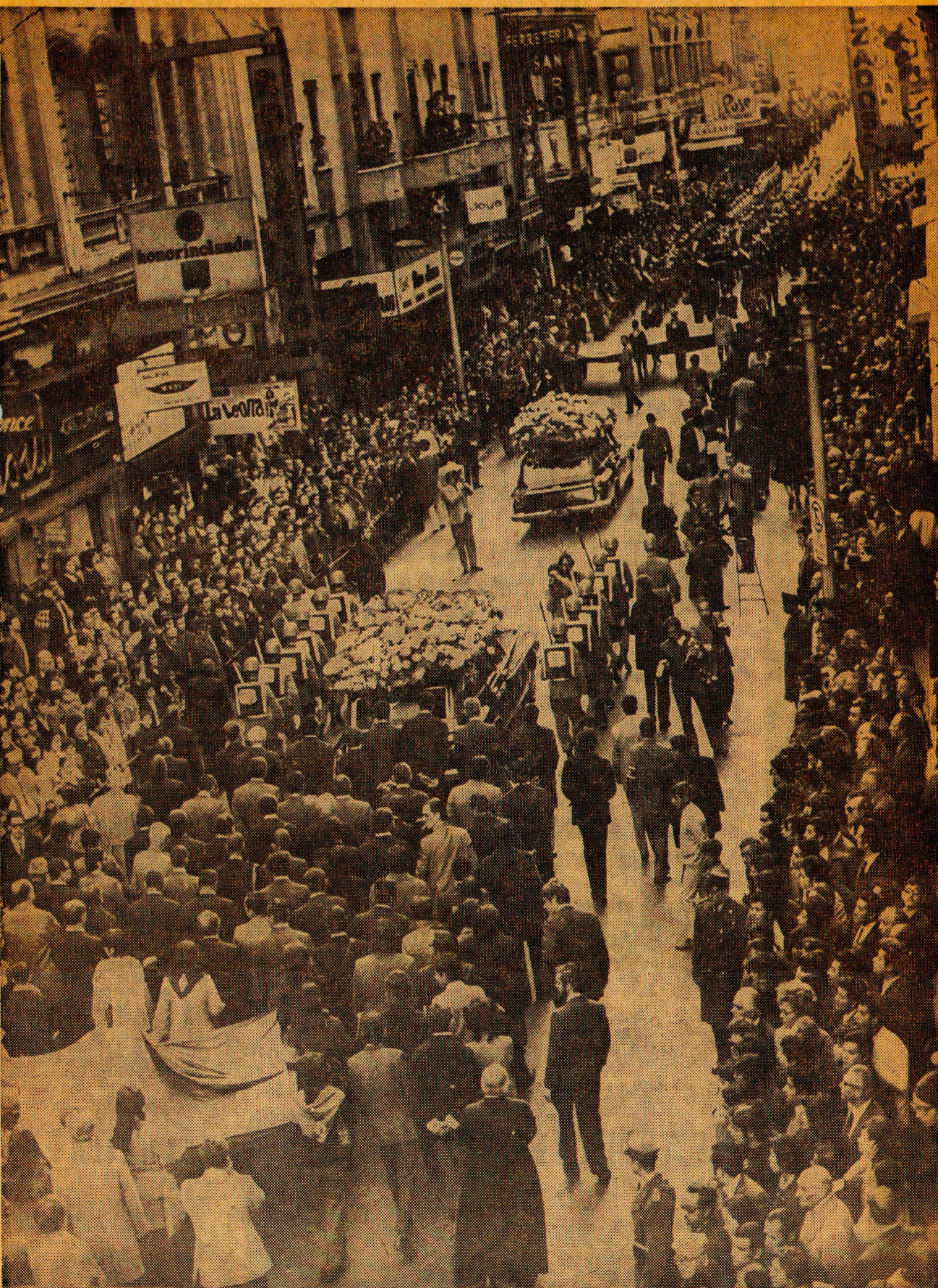
Seguido por millares de camaradas del Partido Demócrata Cristiano, representantes de los Poderes Legislativo y Judicial, avanza por calle Puente rumbo al Cementerio General, el carro mortuorio que lleva los