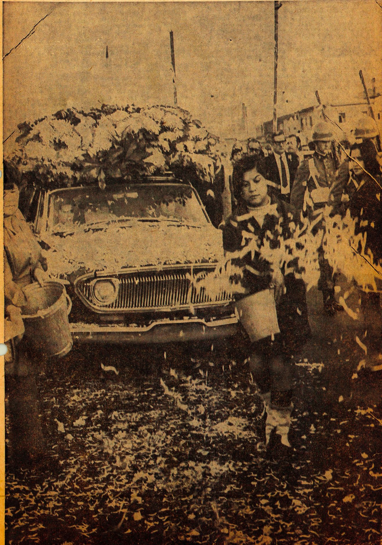
Como nomenaje póstumo al ex Vicepresidente de la República, Edmundo Pérez Zujovic, floristas de las pèrgolas de Mapocho cubren con pétalos de crisantemos el camino que sigue por Avda. La Paz el carro