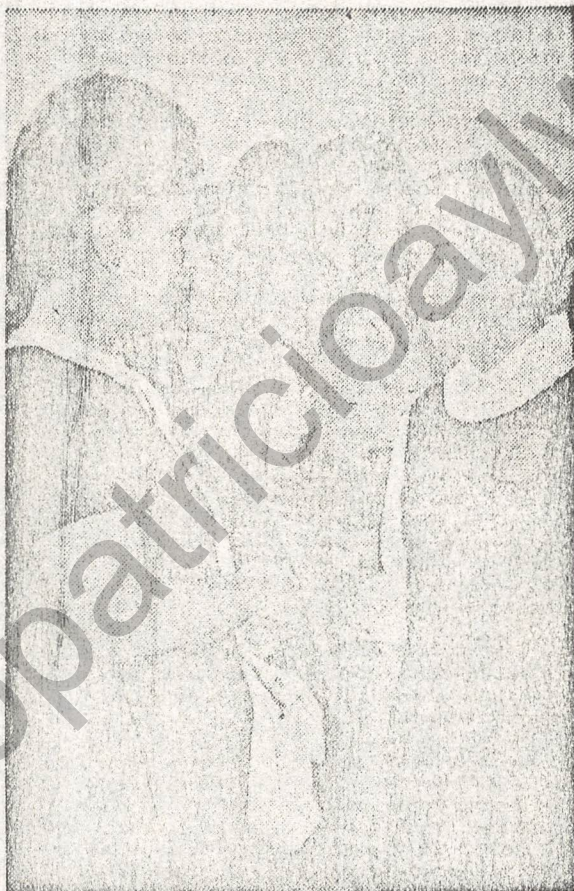
CON LAS ALUMNAS

Al contar con esto hace un poco de historia: "Es necesario mostrar que desde hace años que se viene planteando en Chile un cambio profundo en la educación, cuyo efecto fundamental ha sido facilitar una oportunidad real de educación integral a los niños de Chile, y le una oportunidad real de ingreso al trabajo, con una preparación adecuada y que le abra nuevas perspectivas en su ingreso a estudios superiores".