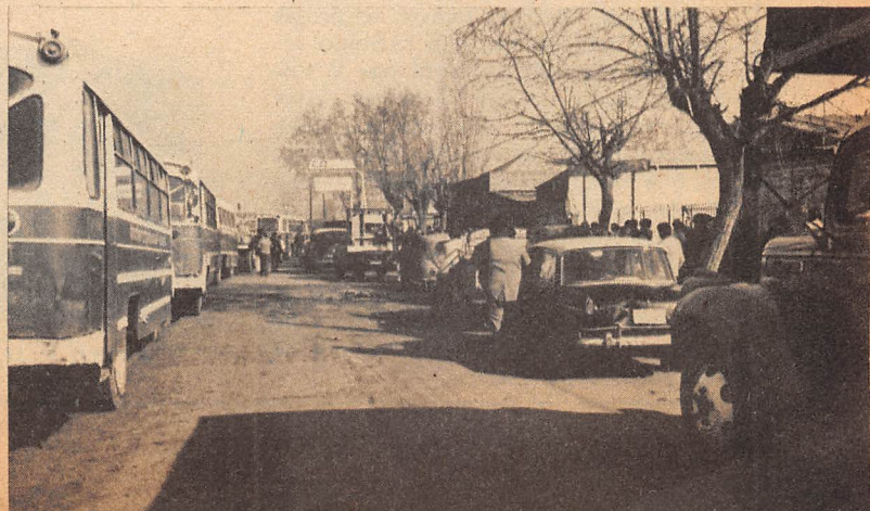
"COLAS DE LA BENCINA Sin miedo a los "miguelitos".