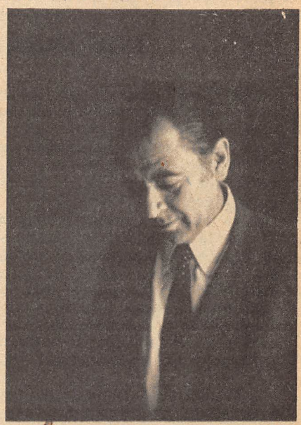
AYLWIN La tregua no era la solución, pero permitía buscarla.

Confidenció a QUE PASA un personero DC: "Hemos hecho un último esfuerzo para que los militares entren al gobierno por la puerta; quiera Dios que la situación del país no los haga entrar por la ventana".