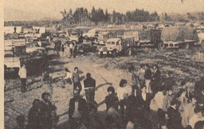
PARQUE DE CAMIONEROS La apuesta de "Bachelet".

Recorrimos la parcela dando un detenido vistazo a esos camiones gastados. "Bachelet" gana la apuesta.