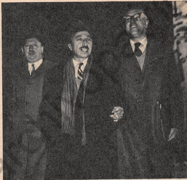
La "troika" del PC: antes como ahora

tariado de las JJ. CC. y en un frente que los comunistas —desde los tiempos de Lenin y Recabarren— han considerado siempre vital: el periodístico.