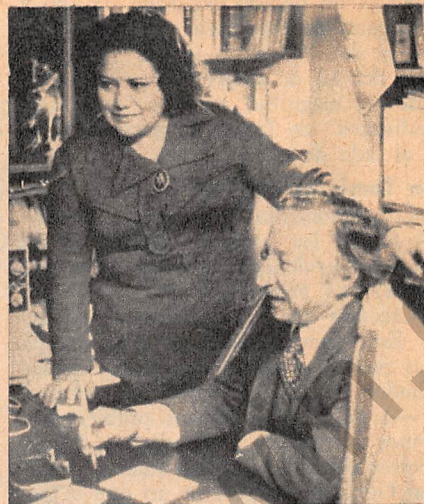
Con su esposa y secretaria

Ella, morena, dicharachera, más joven que su marido, cuenta espontáneamente: "El compañero me enganchó