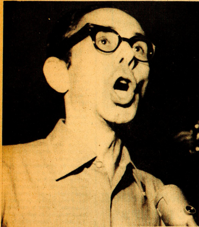
EL SECRETARIO GENERAL del Socialismo hablando en el Caupolicán.

—¿Cuál es su opinión frente al MIR y qué tarea positiva pueden ellos asumir, según su punto de vista? —"Personalmente, tengo una opinión positiva frente al MIR. Creo que, a pesar de no haber participado de manera efectiva en la elección que culminó con la victoria de Salvador Allende, su conducta ha contribuido a desarrollar y fortalecer una conciencia revolucionaria en nuestro país. De más está decir que no participo de todas sus posiciones tácticas. No soy mirista. Soy socialista. Pero nuestro criterio nunca ha sido excluyente frente a otras fuerzas revolucionarias de la izquierda chilena. Las tareas que puede