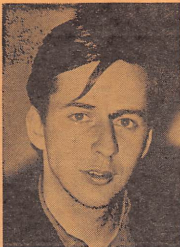
MIGUEL ENRIQUEZ: Secretario General del MIR.

públicamente planteadas siguen rodeando los hechos de Concepción y sus antecedentes; quién introdujo la violencia a las Universidades, que pudo haber muerto cualquiera y no necesariamente un mirista. ¿Cuál es la opinión del MIR sobre todo ello?