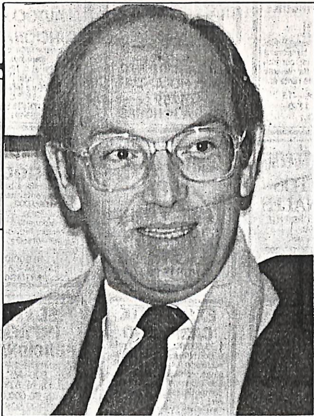
Ricardo Ffrench-Davis: "Hay una voluntad seria de buscar acuerdo, primero entre los partidos de oposición y luego, en una transición pacífica entre la oposición, los partidarios del gobierno y las Fuerzas Armadas".