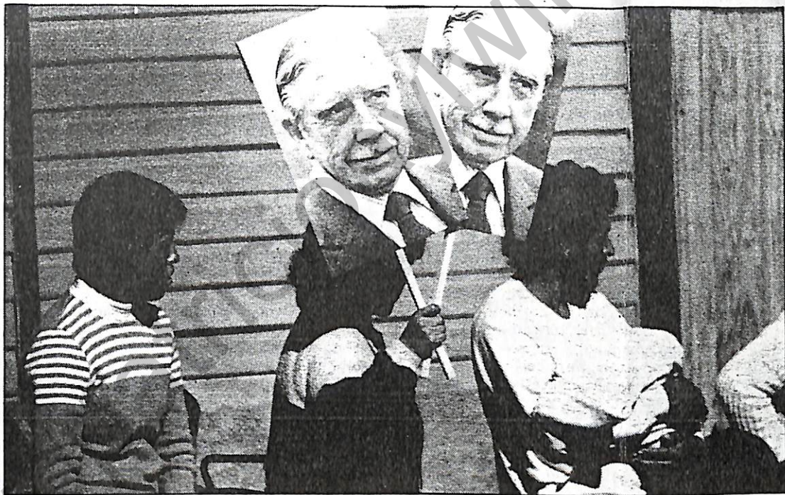
Desde temprano, grupos de personas con carteles esperaron a Pinochet en Petorca, Cabildo y La Ligua.

"El gobierno no abandonará jamás el compromiso que tiene con ustedes de entregarles una vivienda digna, salud y aquí, gracias al apoyo de Enami, más tra-