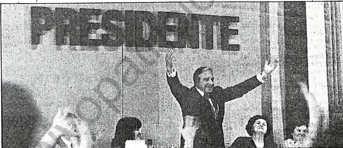
Pinochet se autoproclamó candidato constitucional ante cuatro mil 500 viñamarinas.

Afirmó que con este plebiscito termina una etapa, "porque al finalizar el año 89, el 10 o el 11 de marzo de 89, se inicia un nuevo período, donde se establecen Cámaras de Diputados y