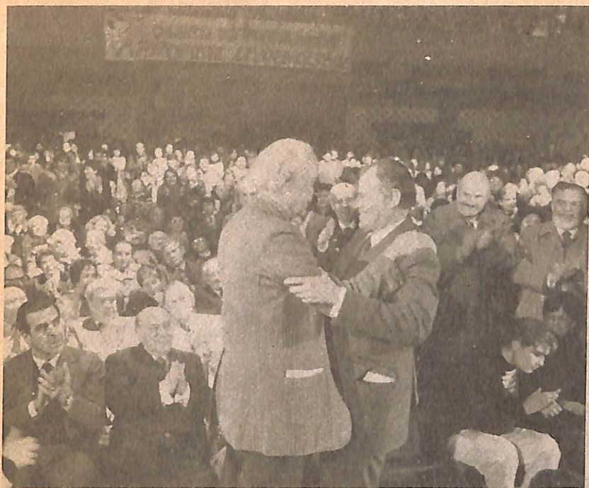
◀ El abrazo de la democracia y la cultura. El pintor Nemesio Antúnez saluda a Patricio Aylwin en su encuentro con artistas e intelectuales.

▶ Desde mucho antes de ser designado el candidato de las fuerzas democráticas, Patricio Aylwin ha demostrado un decidido compromiso con las aspiraciones de los trabajadores chilenos.