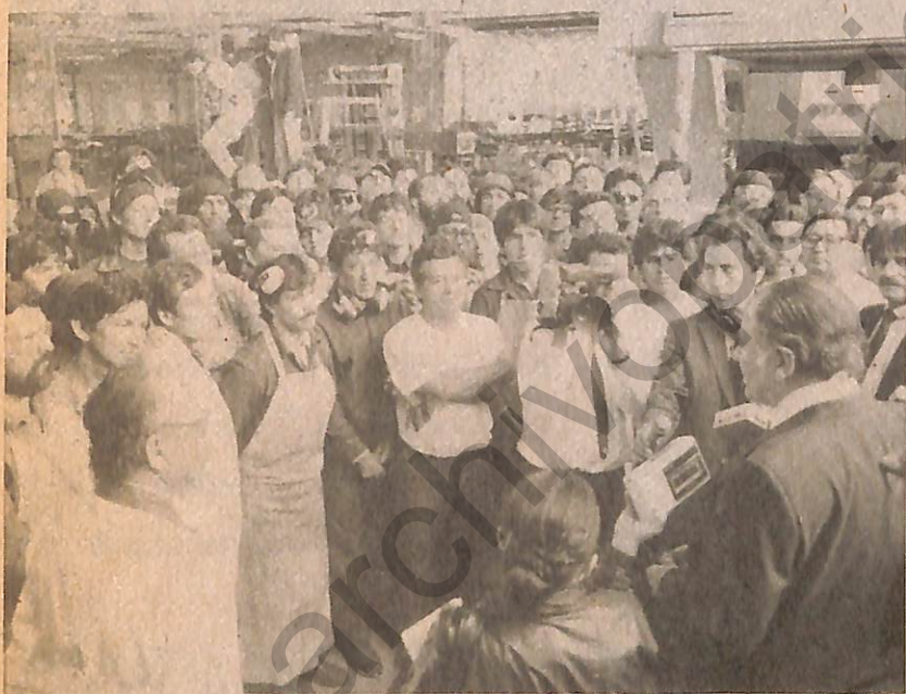
La juventud y su futuro, un tema central en las inquietudes del abanderado de las fuerzas democráticas.

▶ Desde mucho antes de ser designado el candidato de las fuerzas democráticas, Patricio Aylwin ha demostrado un decidido compromiso con las aspiraciones de los trabajadores chilenos.