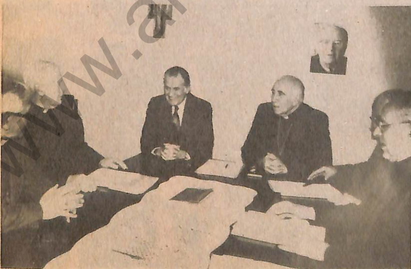
▶ Ha recorrido incansablemente el país en su cruzada por la recuperación democrática. Dialoga con todos, a todos escucha, también a los jóvenes universitarios.