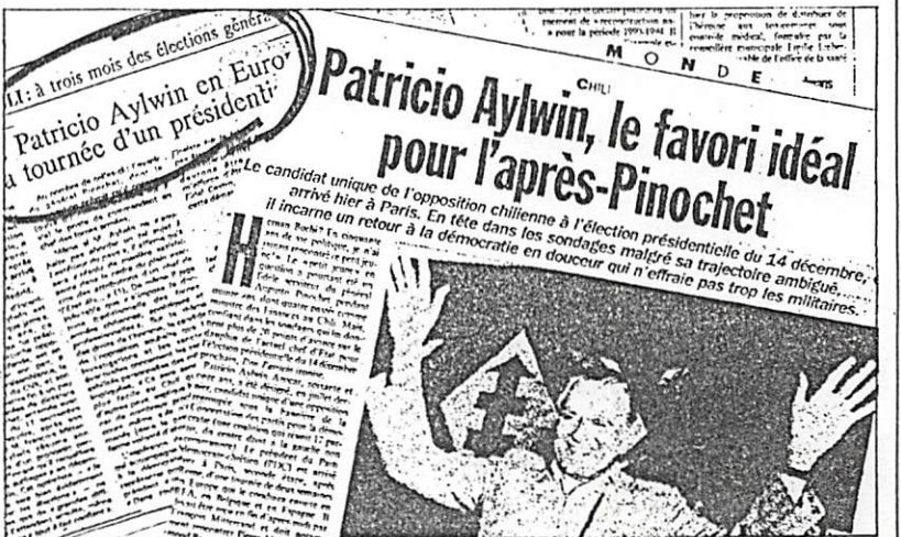
Amplia cobertura a la estadia de Aylwin en Francia.

La nota de Le Monde señala que los pronósticos de las encuestas le dan un 60 por ciento al líder opositor en diciembre. También cita una frase de Aylwin: "Lo más fácil será evidentemente ganar las elecciones... Las grandes dificultades vendrán después".