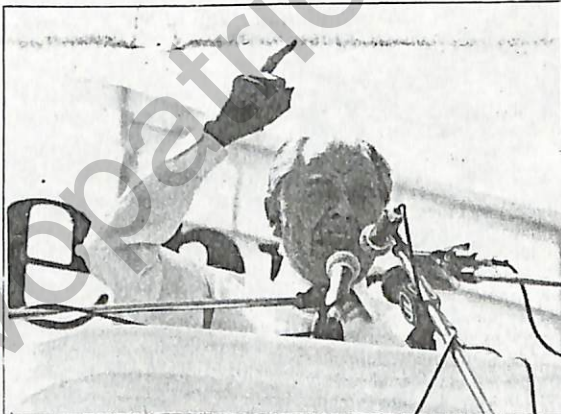
Criticó a quienes "carecen de autoridad moral para hablar de libertad".

el escenario eran de una huelga legal de los trabajadores de Abastible, de una huelga legal de mineros de Lota y uno de la feria de artesanos Tremafin, además de grandes banderas de la CUT.