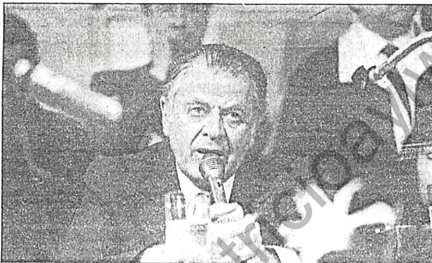
Patricio Aylwin será recibido mañana por el Presidente de Alemania Federal.

Estas, según dijo, apuntarán a dar —precisamente— una mayor estabilidad al modelo de economía social de mercado "y no meramente de libre mercado".