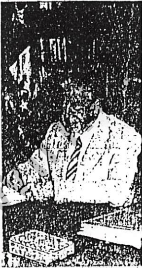
ELECCION. — El Presidente de la República, general Augusto Pinochet, ha sometido la proyección de su gobierno a la decisión de la mayoría ciudadana en el plebiscito que se efectúa hoy.

La jornada se prolongará hasta el último escrutinio oficial provisorio entregado por el Centro de Cómputos del Ministerio del Interior, lo que se estima ocurrirá cerca de la medianoche. El resultado definitivo será dado a conocer a las 7 horas, con la constitución de las 22 mil 247 mesas instaladas en 800 locales a lo largo del país. La jornada se prolongará hasta el último escrutinio oficial provisorio entregado por el Centro de Cómputos del Ministerio del Interior, lo que se estima ocurrirá cerca de la medianoche. El resultado definitivo será dado a conocer a las 7 horas, con la constitución de las 22 mil 247 mesas instaladas en 800 locales a lo largo del país. (Continúa en la página A 8)