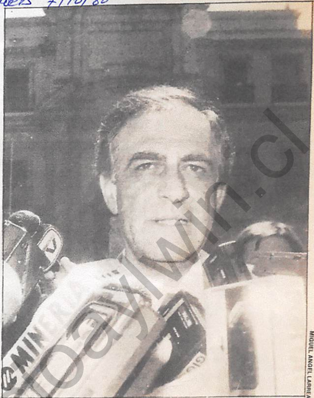
Sergio Fernández: despedido y confirmado.

Fue la respuesta que dio Pinochet al veredicto de las urnas.