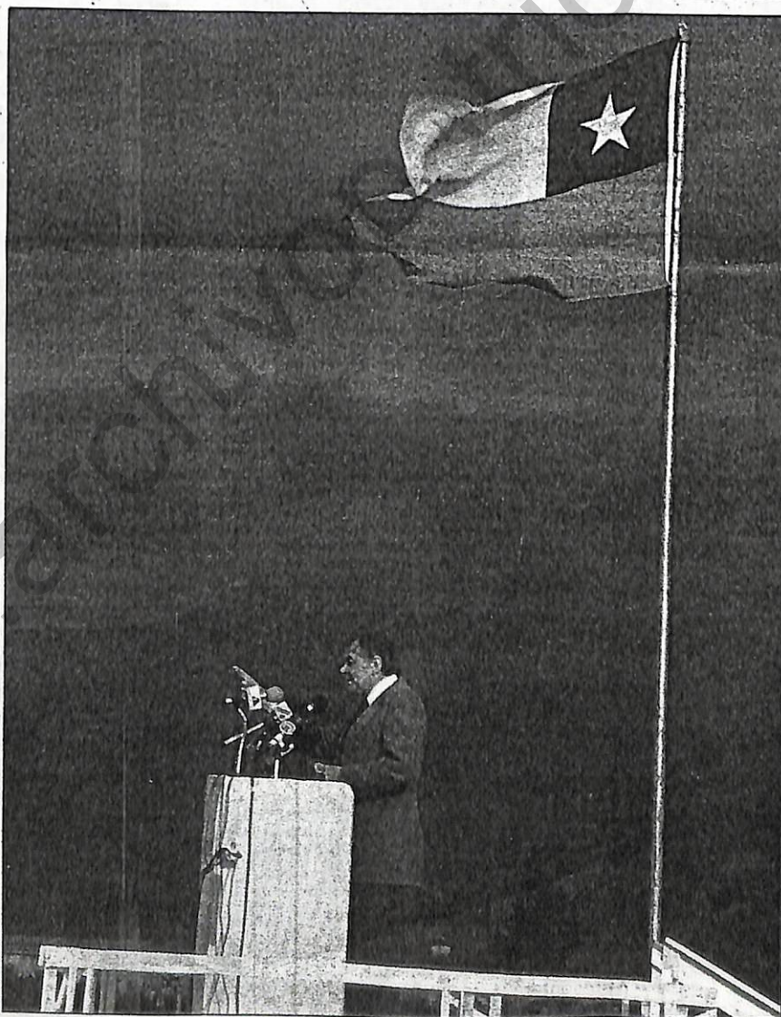
Aylwin en la fiesta de celebración del triunfo opositor

Patricio Aylwin habla ante decenas de miles de personas reunidas en la tarde de ayer en Grecia con Campos de Deportes, comuna de Nuñoa, en una grandiosa celebración del triunfo de la Concertación.