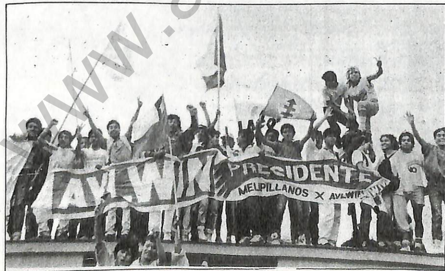
El público asistente estuvo constituido principalmente por jóvenes.