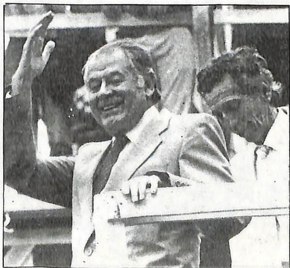
El Presidente electo arribó al escenario poco antes de las 19 horas.