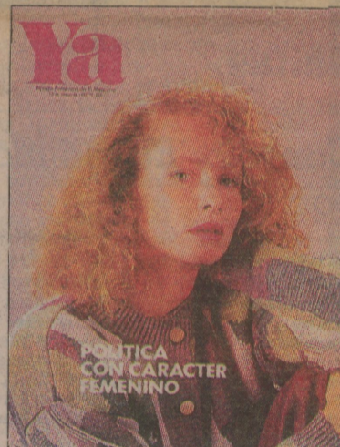
Esta edición incluye la revista femenina "Ya".