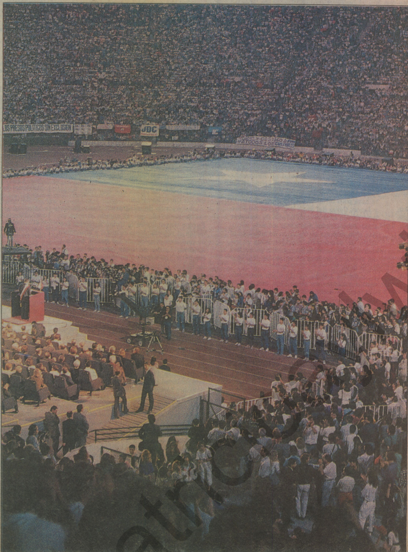
MULTITUDINARIO ACTO EN EL ESTADIO NACIONAL.— El Presidente de la República, Patricio Aylwin, fijó ayer las prioridades que orientarán su gestión gubernamental, en un discurso pronunciado como término de un imponente acto popular en el Estadio Nacional, que contó con la presencia de personalidades internacionales y del país. Una gigantesca bandera nacional cubrió casi totalmente la cancha en tanto que las apostadurias se repletaron de público.

namiento expedito de la renaciente democracia chilena". Reclamó el Jefe de Estado que los chilenos acaten las vías de la razón y el derecho para promover sus aspiraciones, absteniéndose de acudir a la violencia; a la vez que expresó su certidumbre de "que si alguien llegara a abrigar la tentación de emplear la fuerza contra la voluntad del pueblo, nuestras Fuerzas Armadas y de Orden no se apartarán de sus deberes institucionales". El gobernante recaló que la delicada problemática de los derechos hu- (Continúa en la página A 11)