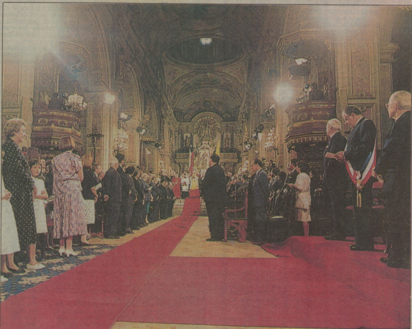
SOLEMNE TE DEUM EN LA CATEDRAL METROPOLITANA.— El Cardenal Arzobispo de Santiago, monseñor Juan Francisco Larraín, celebró ayer un solemne Te Deum ecuménico con motivo de la asunción al mando del Presidente Patricio Aylwin. El Te Deum se inició a las 9.35 horas con la llegada al templo del nuevo Jefe del Estado, quien fue recibido cálidamente por los aproximadamente cuatro mil invitados. En la fotografía se observa al Mandatario, acompañado del presidente del Senado, Gabriel Valdés, y el presidente de la Corte Suprema, Luis Maldonado.

vez, intercederá para lograr una buena cooperación en las instituciones internacionales financieras. Quayle, quien finalizó ayer su visita a Chile para proseguir su gira por la región con un viaje a Paraguay, hizo estos planteamientos luego de reunirse por media hora en La Moneda con los Ministros del Interior, Enrique Krauss; de Hacienda, Alejandro Foxley, y de Defensa, Patricio Rojas, ade- (Continúa en la página A 12)