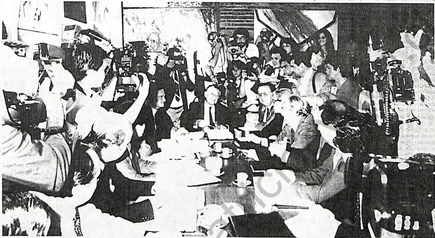
La reunión de gabinete, en el momento en que se permitió la entrada de los fotógrafos

Se celebró ante expectación de la prensa