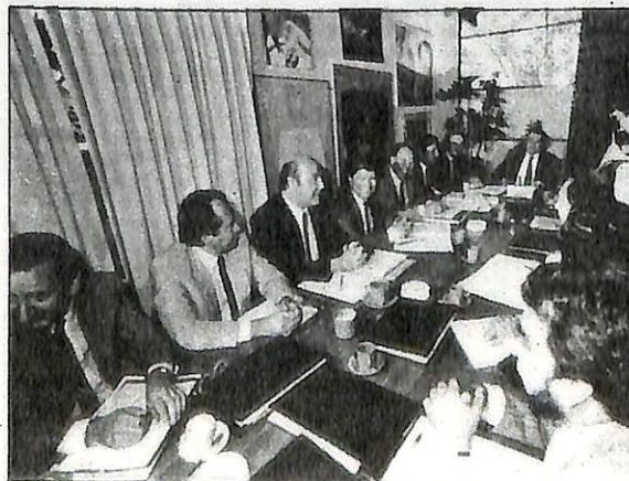
Cada ministro designado recibió una carpeta con instrucciones.