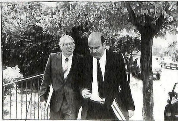
Los ministros Abelluk y Rojas.

Manifestó que uno de los temas preocupantes es el alza de tarifas de la locomoción colectiva, "ya que hay factores inflacionarios internos y externos que están operando en este caso"; y el problema de la contaminación, "donde conversaré con todos los sectores interesados para buscar una solución".