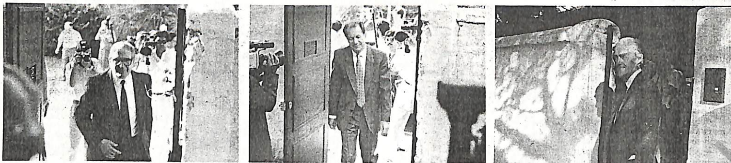
Entran el futuro Canciller, Enrique Silva Cimma, el ministro de Educación, Ricardo Lagos y el Secretario general de la Presidencia, Edgardo Boeninger.

señala que las Fuerzas Armadas están subordinadas al Presidente de la República como generalísimo y por delegación en el ministro de Defensa y que por este motivo esperaba tener buenas relaciones con ellas.