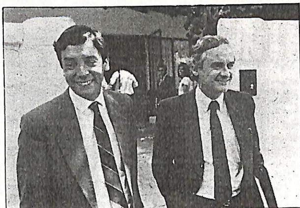
Una dupla clave: los ministros de Economía y Hacienda.