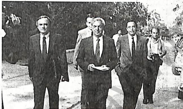
Llega el "equipo económico": Alejandro Foxley, Sergio Molina y Carlos Ominami