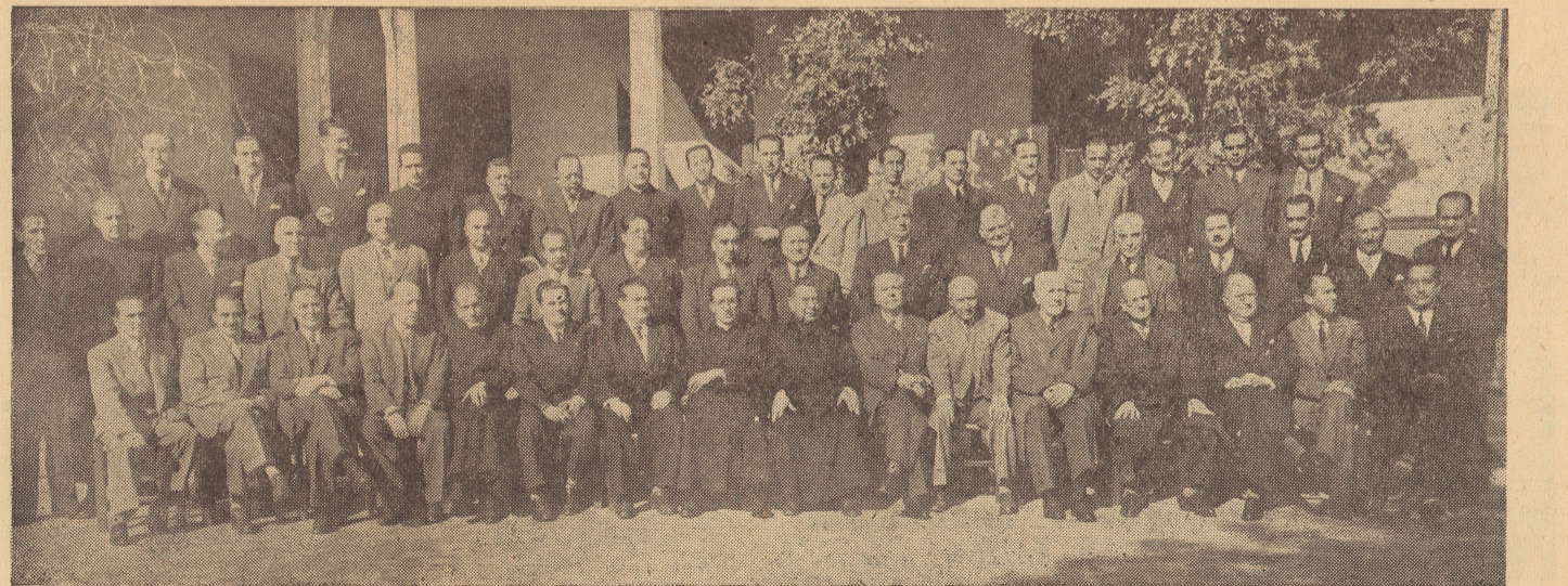
LA FOTO PRESENTA A UN GRUPO NUMEROSO DE EX ALUMNOS EN SUS NUMEROSAS REUNIONES DE ESTUDIO Y CAMARADERIA...