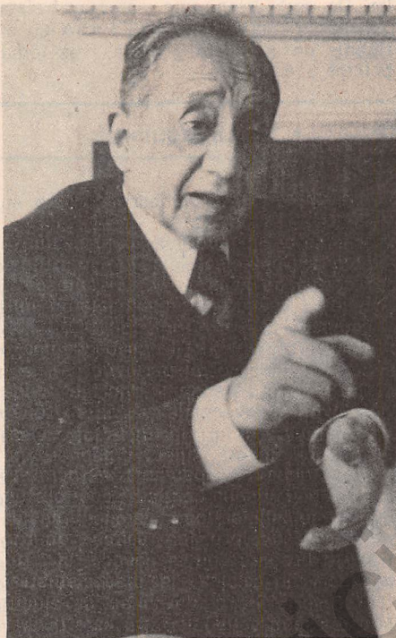
Bernardo Leighton: pacificad, que algo queda.

Algunos Dc se irritan con ello; otros lo aceptan con resignación; otros con alegría. Pero no cabe duda de que Eduardo Frei sigue siendo la figura dominante del partido "disuelto". La cosa viene de 1954, cuando Frei era senador de la Falange, y el entonces Presidente Ibáñez buscaba quién lo sacara de una profunda crisis política y económica. Frei ofreció hacerlo, asumiendo el Ministerio del Interior y renunciando a su puesto parlamentario. En definitiva, la "gestión Frei" no prosperó (Ibáñez prefirió a Jorge Prat, quien tomó la cartera de Hacienda, con Arturo Olavarría en Interior), pero hizo del senador falangista una figura nacional... y la autoridad indiscutida de su partido. Este siempre ha obedecido cuando Frei se ha jugado. La Dc, en cierto modo, ha sido empujada por Frei; éste (dijo alguna vez Julio Durán) era "un sauce llorón plantado en un macetero" (el partido). Los democristianos se enojan con la comparación, pero en el fondo, no dejan de hallarla cierta. Por eso Frei es para ellos "el ropero de tres cuerpos", "el Tata" o "el Viejo" (como Adenauer). Los dos últimos apodos señalan la inexorable limitación de Frei y, en general, de toda la "vieja guardia" falangista