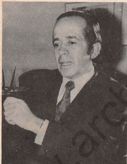
Andrés Zaldívar: "No" a los comunistas.

Yungue, Salazar y Aylwin mantienen contacto con organizaciones y pensamientos extranjeros, semejantes a los suyos, y han viajado a Venezuela, España, otros