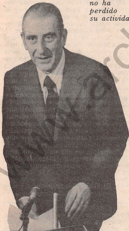
Eduardo Frei: "El Viejo" no ha perdido su actividad.