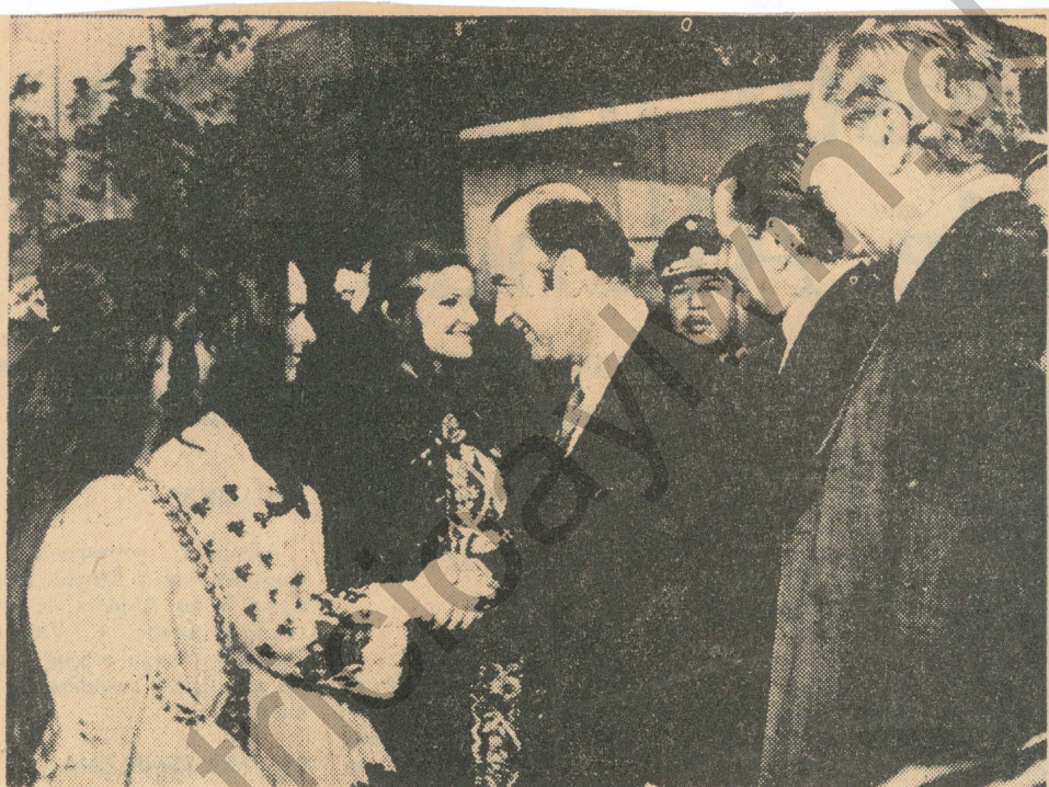
Una sonrisa y un apretón de manos. Esa fue la bienvenida de agraciadas jóvenes que se desempeñaban como guías en el stand de Yugoslavia, cuando la comitiva oficial efectuó el tradicional recorrido por las dependencias de la FISA.— EN EL GRABADO, el Ministro de Economía recibe el saludo de una dama vestida a la usanza yugoslava. Observan el Canciller Gabriel Valdés y el Presidente de la SNA, Benjamín Matte.

En el stand de la CORFO recibieron a las autoridades con un esquinazo y un pie de cueca, a cargo del con-