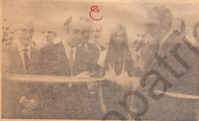
● EL MINISTRO DE ECONOMIA, Carlos Figueroa y el de Relaciones Exteriores, Gabriel Valdés, proceden a cortar la tradicional cinta tricolor, inaugurando oficialmente FISA-70.

Posteriormente, el presidente de la FISA, Máximo Valdés Fontecilla, se dirigió a los representantes del Gobierno, Cuerpo Diplomático y autoridades civiles y militares que asistieron a la inauguración. Más tarde, hizo uso de la palabra el Ministro de Economía, Carlos Figueroa. Luego, los funcionarios, diplomáticos y demás asistentes recorrieron los distintos sectores de la Feria.