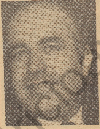
CARLOS FIGUEROA Ministro de Economía

"La liberación de importaciones es un suicidio económico para un país en desarrollo. Si el Gobierno deseaba poner atajo a los abusos de la industria nacional, pudo dictar normas técnicas de control o buscar otros mecanismos que agilizaran la competencia. Pero abrir el mer-