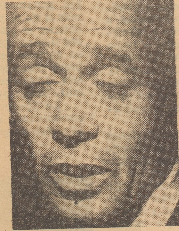
ANDRES ZALDIVAR Ministro de Hacienda

cado nacional a la producción extranjera, es retornar a prácticas superadas del libre-cambismo, que significaron la ruina chilena en el pasado. Basta pensar qué ocurrirá, por ejemplo, a los fabricantes de refrigeradores, cuando tengan que competir