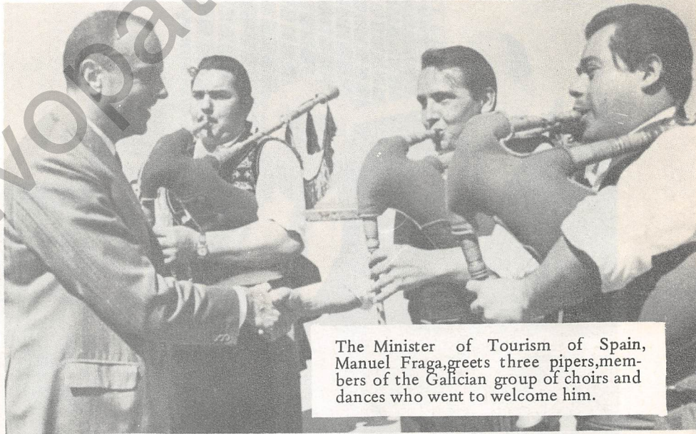
The Minister of Tourism of Spain, Manuel Fraga, greets three pipers, members of the Galician group of choirs and dances who went to welcome him.

It's colours are those of the Chilean flag: red, white and blue with the white lone star. The person who appears on same is the President of the Chilean Republic, Mr. Eduardo Frei Montalva. He is drinking "chicha" (fermented grape juice) from a drinking horn ("cacho") offered to him by a group of mounted country people ("huasos") in their typical costumes. Immediately afterwards he will listen to the songs of a folklore group and observe the Chilean national dance: the "cueca". Right after that he will give the order to commence the military parade on occasion of the 159th anniversary of Chile's Independence Day.