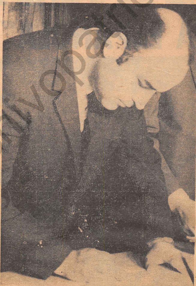
El nuevo Ministro de Economía, Carlos Figueroa, inaugurará hoy el Congreso Internacional de Turismo, en el Salón de Honor del Congreso Nacional.

Pues hoy, a partir de las 10 horas, el encuentro entrará efectivamente en funciones, al ser inaugurado solemnemente en el Congreso Nacional. Luego de los discursos respectivos, el Secretario General Permanente del Congreso Internacional rendirá la cuenta de rigor. A las 13 horas, los delegados almorzarán en diversos hoteles. Dos horas después comenzará el trabajo de comisiones. Y a las 20 concurrirán a una recepción que les ofrecerá la Municipalidad de Santiago.