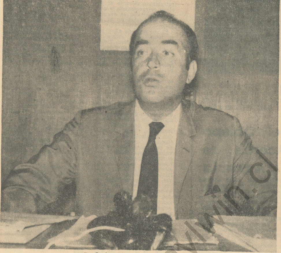
D. Carlos Figueroa, Ministro de Economía

El señor Ministro de Economía acepta la formación del Grupo de Trabajo que se le propone y se ACUERDA que entre el Instituto de Costos, ICHA y ASIMET se suscriba un convenio.