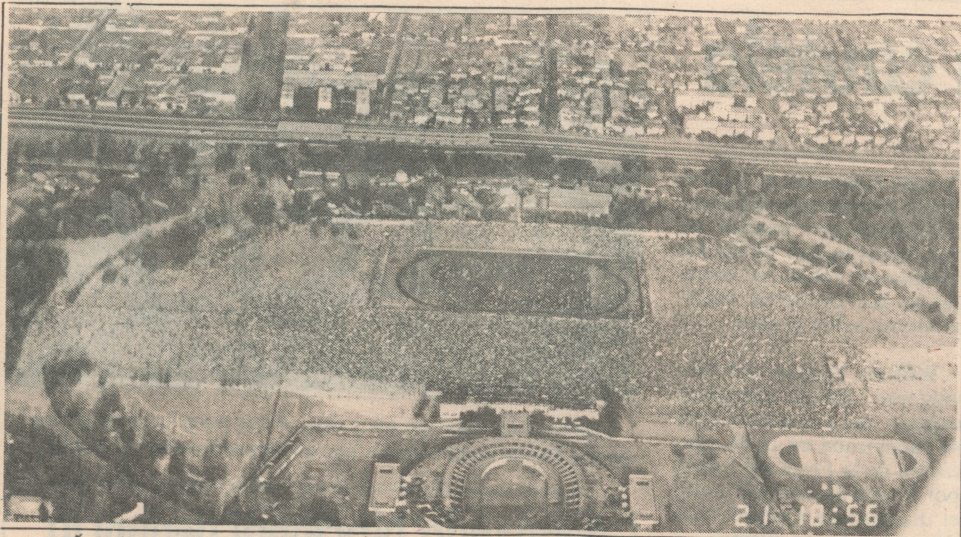
AYER.- Vista aérea de la concentración de ayer en el Parque O'Higgins, captada a las 18,56 horas.